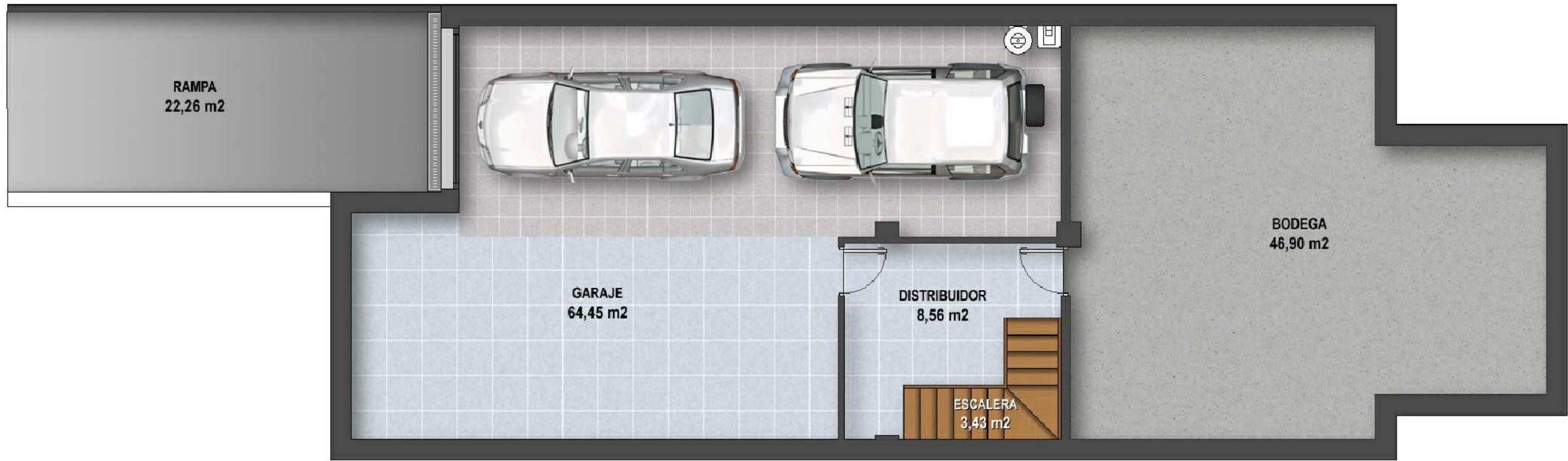
PLANTA SÓTANO VIVIENDA TIPO E.1/75