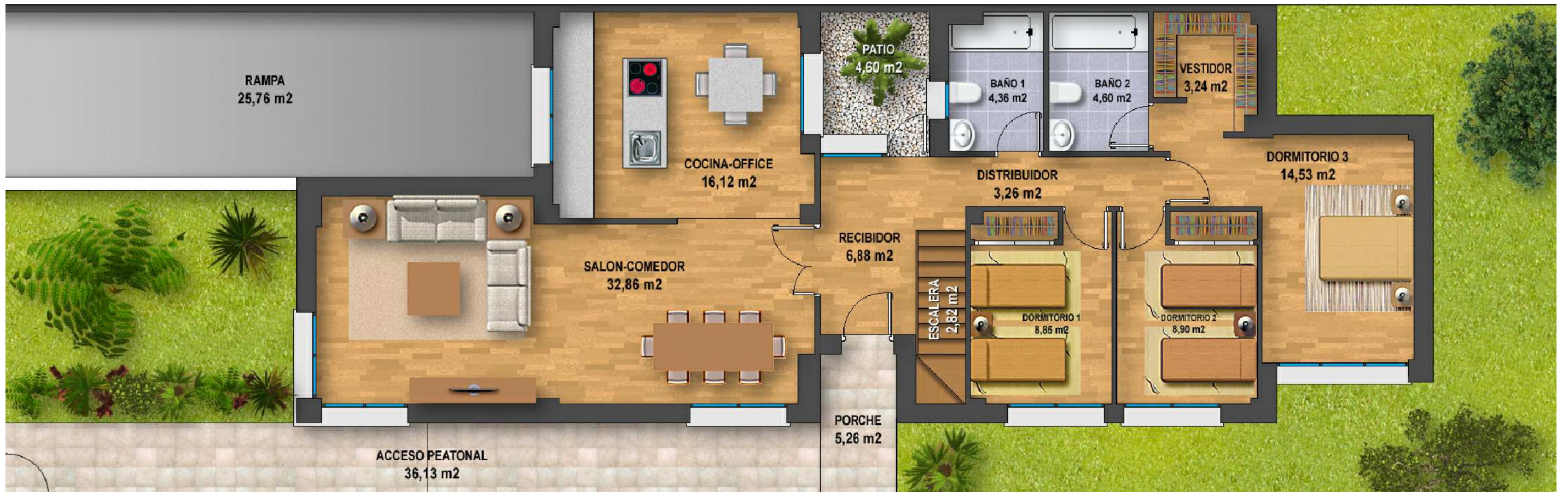
PLANTA BAJA VIVIENDA TIPO E.1/75